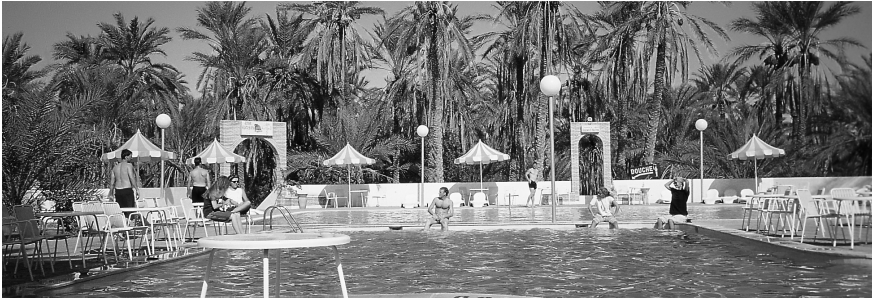
M1 In der Oase Douz

Die Oase Douz liegt in Südtunesien. Fast 30 000 Menschen leben heute in der Oase. Das ist die Einwohnerzahl einer Kleinstadt in Deutschland! Wie und warum hat sich die Oase verändert?